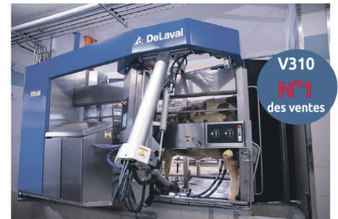
ROBOT DeLaval VMS™ V300 et V310