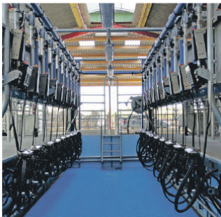
Salle de traite : Traite par l'arrière ou EPI 50° et 30°