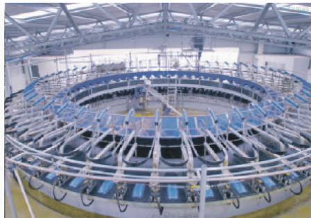
NOUVEAU SYSTEME ROTO E100