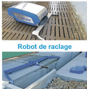
Robot de raclage Racleur à lisier Chaîne - Câble - Hydraulique